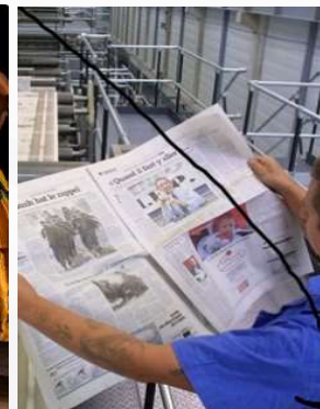
Accompagnement et services